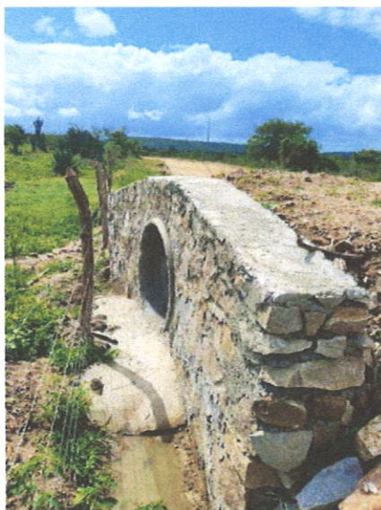
Foto do bueiro 13, no trecho Sede Serra Branca.

Item: na imagem mostra o bueiro concluído no sentido leste da estrada.