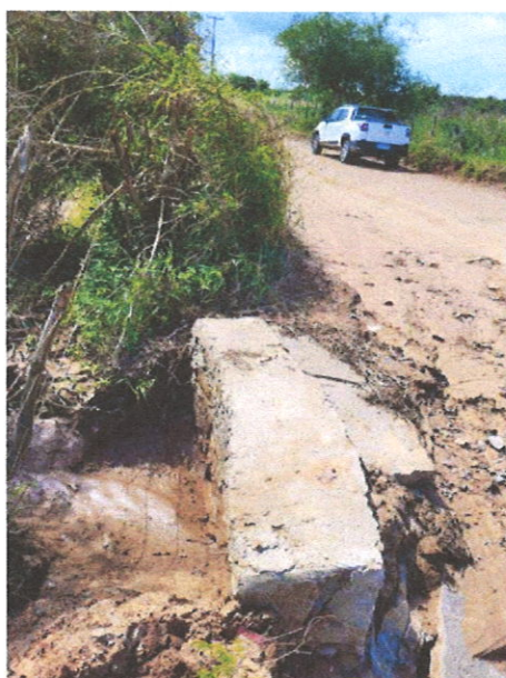
Foto do bueiro 15, no trecho Sede Serra Branca.

Item: na imagem mostra o bueiro concluído no sentido leste da estrada.