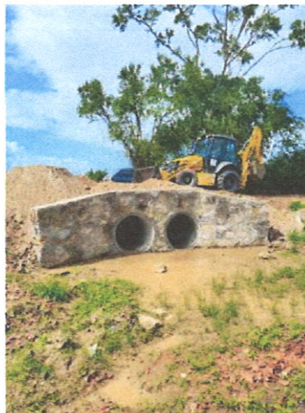
Foto do bueiro 11, no trecho Sede Serra Branca.

Item: na imagem mostra o bueiro concluído no sentido leste da estrada.