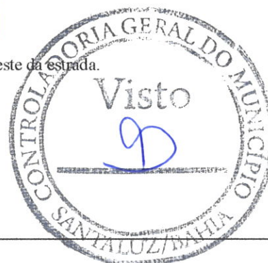
Imagem 25

Item: na imagem mostra o bueiro concluído no sentido leste da estrada.