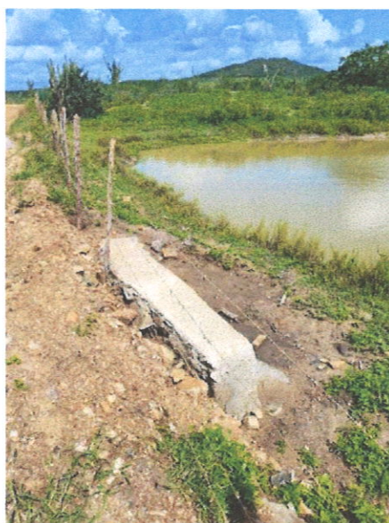
Foto do bueiro 12, no trecho Sede Serra Branca.

Item: na imagem mostra o bueiro concluído no sentido leste da estrada.