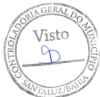
Imagem 21 – Fonte: S. Bruno, 05/2022

Item: na imagem mostra o bueiro concluído no sentido leste da estrada.