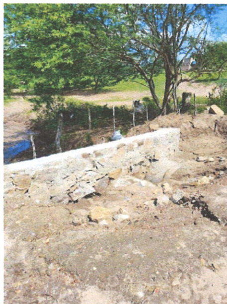
Foto do bueiro 16, no trecho Sede Serra Branca.