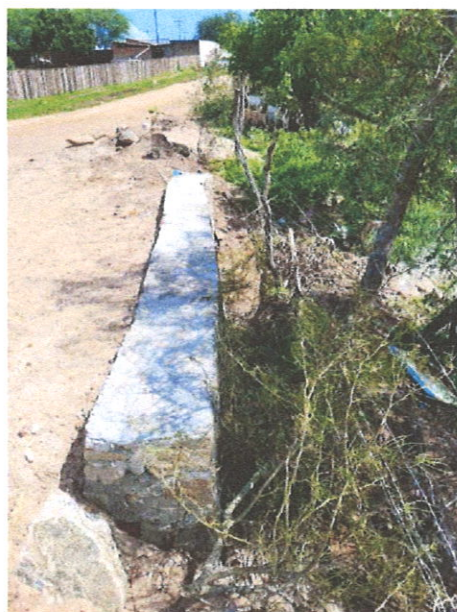
Foto do bueiro 16, no trecho Sede Serra Branca.

Item: na imagem mostra o bueiro concluído no sentido oeste da estrada.